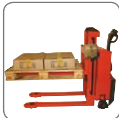
Udstyret kan monteres på højre og venstre side og er let og enkelt at eftermontere.