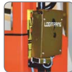
Styreboks med justerbar reaktionstid: 1-10 sek.

Vi tilbyder også kundetilpassede løsninger. Spørg efter flere informationer eller besøg www.logitrans.com