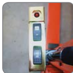
Brugeren indstiller positioneringsudstyret til at løfte eller sænke.