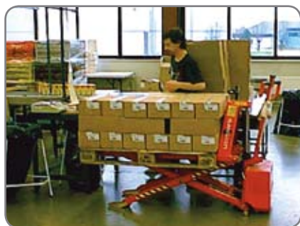
Kan monteres på det elektriske højtløfter- og Logiflex-program (uden teleskopmast).