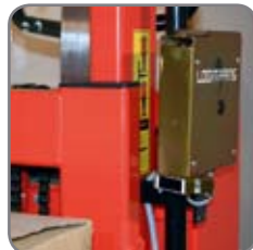
Ved hjælp af en elektronisk føler, løftes gafflerne hver gang gods fjernes, eller sænkes, når gods lægges på pallen.