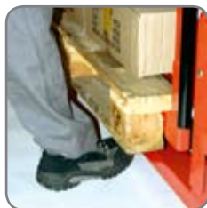
Sikkerhed mod klemskader (i henhold til EN 349:1993).