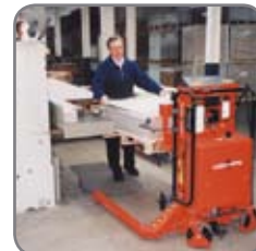
Vognen fungerer samtidig som almindelig løftevogn.