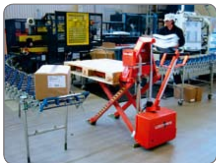
Fotocellen kan på højtløftere justeres mellem 490 og 970 mm og på Logiflex mellem 550 og 920 mm.