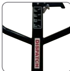
Mulighed for at mærke vognen med navn/afdeling.