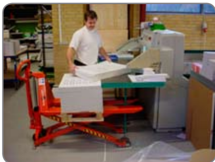
Meget lav pumpekraft er kendetegnende for HL 1005, som også har fodbeskyttelse og neutralstilling.