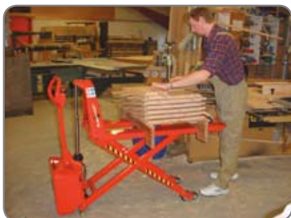
Ekstra udstyr: fjernbetjening, positioneringsudstyr, bremse, separat eller indbygget lader.