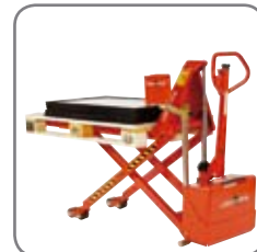
Positioneringsudstyr (ekstra udstyr) sikrer en konstant arbejds højde.