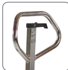
Ergonomisk håndtag giver brugeren et afslappet greb.