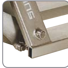
Helt lukkede eller åbne hulrum sikrer effektiv rengøring.