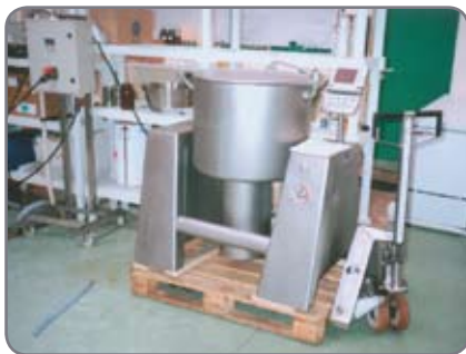
RF-PLUS - til fødevarerindustrien og den farmaceutiske industri, hvor der stilles store krav til hygiejne og rengøring.