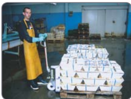
RF-SEMI - til fødevarerindustrien i de områder, hvor hygiejnekravene er mindre, men korrosionsbeskyttelse vigtig.