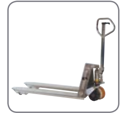
Pallevognen fås også i en eksplosionssikret udgave.