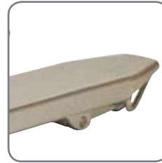
Lukkede gaffler betyder lettere rengøring og færre skjulesteder for bakterier.