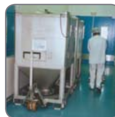
RF-PLUS pallevognen i brug i den farmaceutiske industri.