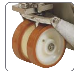
Gummitætnede lejer i hjulene.

Spørg efter materialespecifikationer eller besøg www.logitrans.com Vi tilbyder også kundetilpassede løsninger.